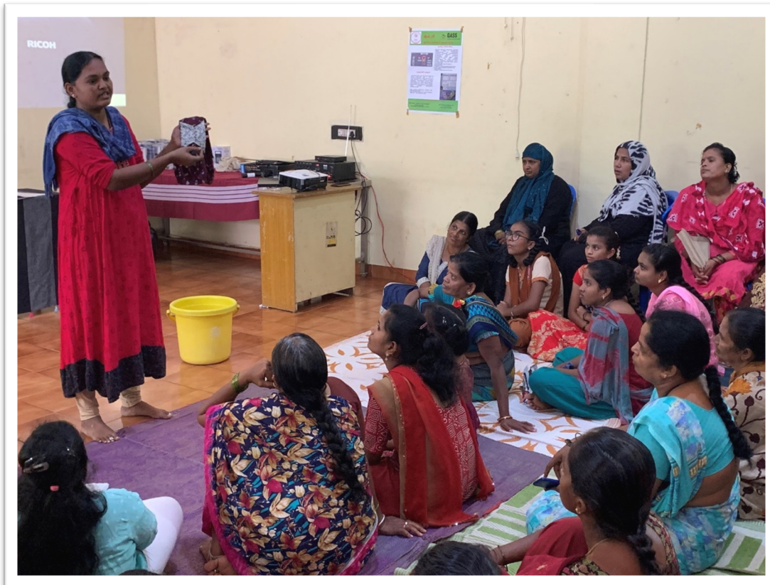
Atelier pour adolescentes et femmes en situation de handicap, vivant en-dessous du seuil de pauvreté. Doddaballapur, décembre 2023

GASS et l'équipe Puṣṣiṇī sont ravis d'organiser un programme supplémentaire pour les femmes et les adolescentes particulièrement vulnérables grâce à un deuxième don spécial de Miblou. Les deux ateliers précédents ont rencontré un vif succès auprès d'un public intéressé et enthousiaste. Les convictions de GASS s'en sont trouvées renforcées : le besoin de sensibiliser les personnes en situation de handicap est le même que pour les autres. Trois ateliers similaires ont ainsi été prévus pour le trimestre à venir, au cours desquels environ 250 kits devraient être distribués gratuitement.