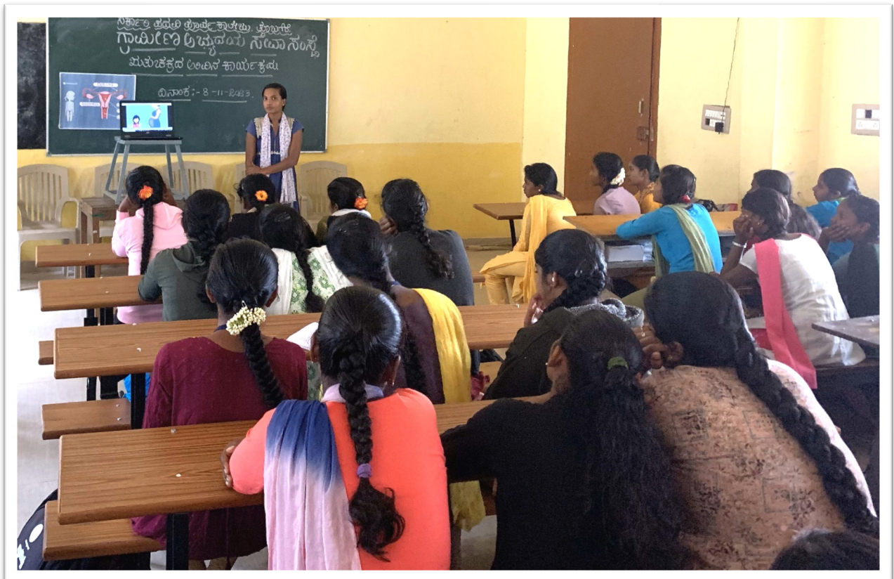
Atelier de sensibilisation au collège pré-universitaire de Tubagere - Novembre 2023