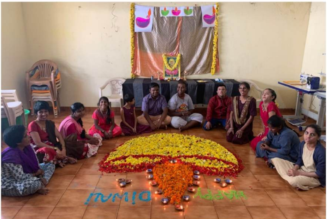
Célébration de Diwali, la Fête des lumières par les résidents de la Maison de Partho. GASS, Doddaballpur, novembre 2023.