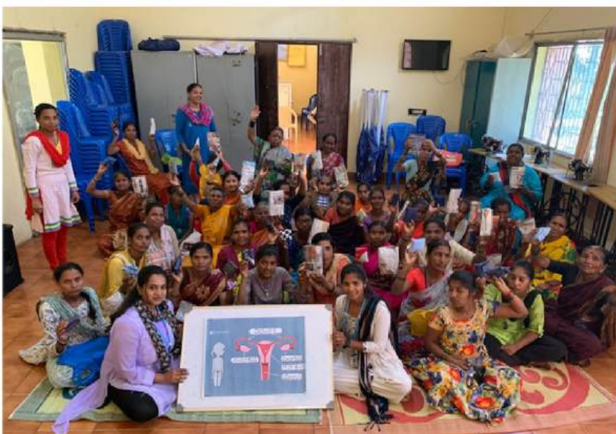
Atelier éducatif pour personnes en situation de handicap. GASS, Doddaballapur.

L'ONG GASS a constaté l'importance de ce type d'actions envers les femmes car les témoignages des participantes aux diverses activités ainsi que les résultats de l'étude de base ont démontré des besoins considérables concernant la formation et la sensibilisation. D'autre part, les différentes structures gouvernementales (écoles, communes, centres de santé, etc.) ont elles aussi apprécié l'utilité de ce projet ce qui démontre une grande prise de conscience avec une ouverture à de futures collaborations dans ce domaine.