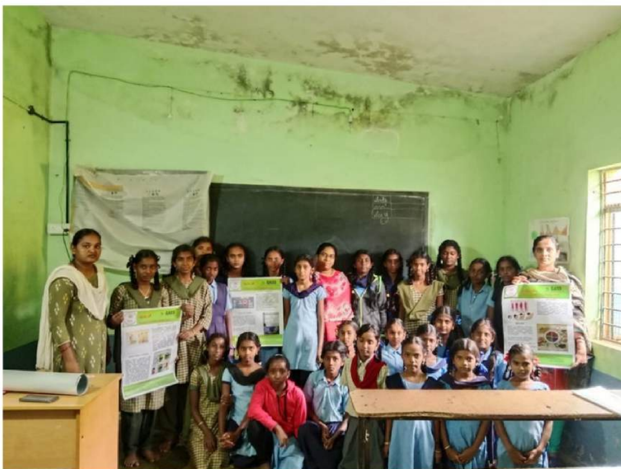
Atelier éducatif à l'école gouvernementale de Thippuru, juillet 2023.

Au total, 4936 personnes ont participé aux différentes actions de cette campagne durant l'année 2023.