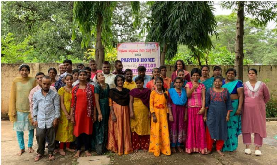
Pensionnaires et apprenants de la Maison de Partho, GASS, Doddaballapur, Juillet 2023.

En 2006, GASS a créé la Maison de Partho à Doddaballapur. Ce foyer offre hébergement et soins à une trentaine de résidents en situation de handicap mental, orphelins ou issus de familles en graves difficultés socio-économiques. Tandis que de nouveaux enfants sont régulièrement identifiés pour bénéficier de cet encadrement, d'autres, devenus de jeunes adultes continuent de fréquenter le foyer où ils peuvent participer à différentes activités.