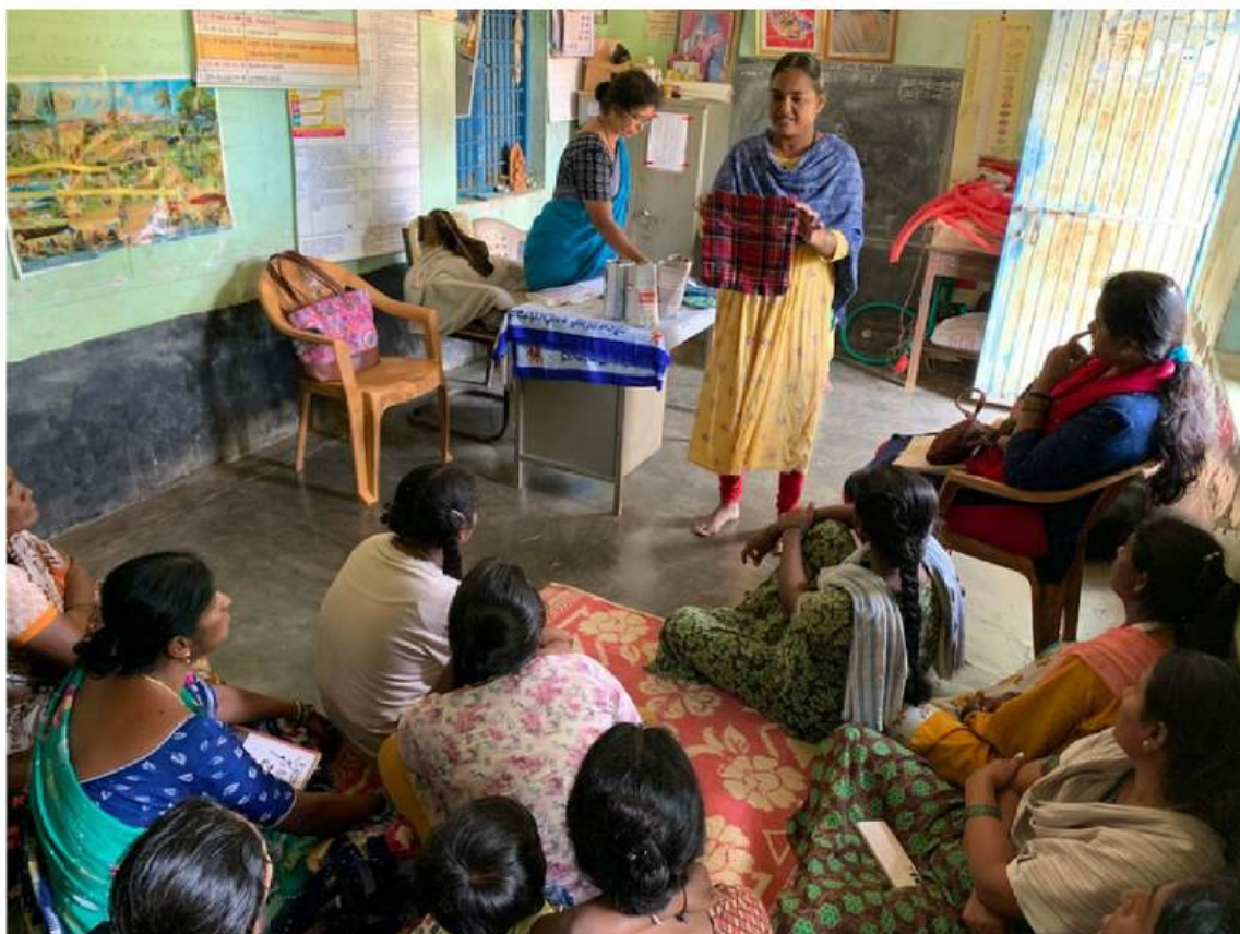
Cours de sensibilisation au centre d'éducation de la petite enfance, C. G. Hosahalli, septembre 2023.