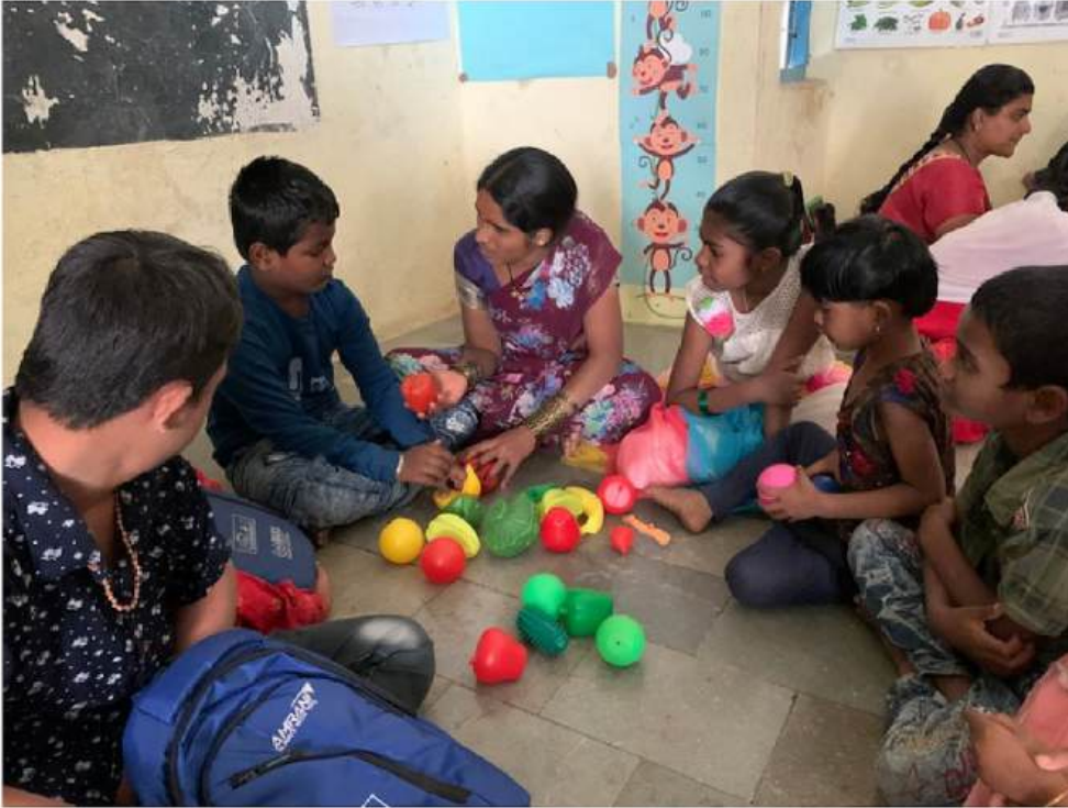
Centre de jour Marikaamba, hébergé par l'école gouvernementale de Naron, District de Kalaburagi.

Depuis le mois de septembre 2023, Miblou et Lokya Yoga travaillent au transfert des parrainages existants. Sur le terrain, GASS et Lokya Yoga collaborent étroitement pour que le dossier de chaque enfant soit tenu à jour de manière diligente. Une cinquantaine d'enfants et de jeunes adultes sont en attente d'être parrainés. A côté des parrainages, les dons libres sont toujours acceptés pour le financement des deux structures mentionnées ci-dessus.