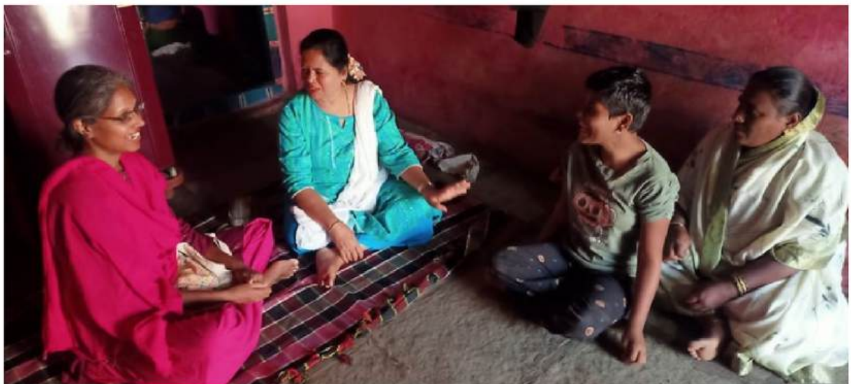
Visite et suivi des enfants à la maison lorsque leur handicap sévère rend leur déplacement difficile.